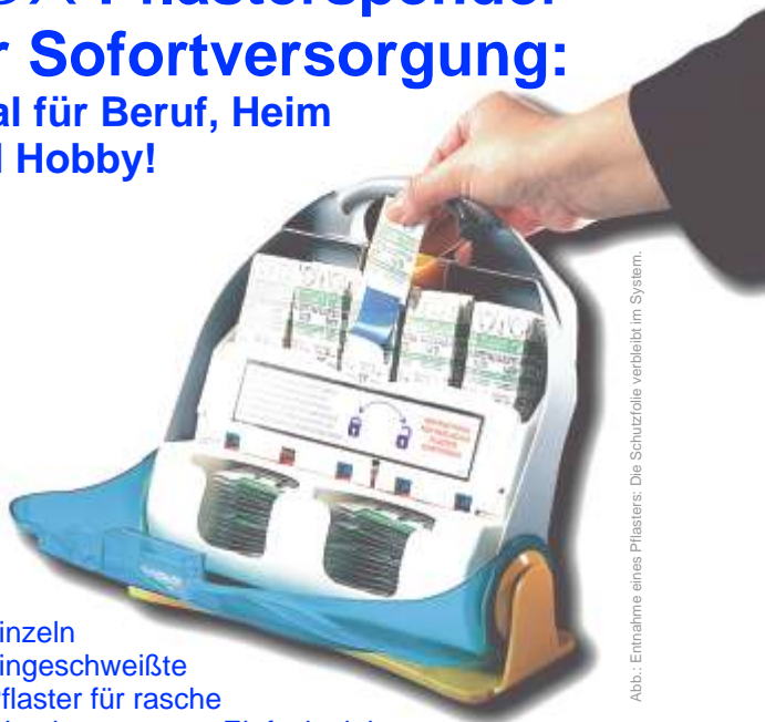
Abb.: Entnahme eines Pflasters: Die Schutzfolie verbleibt im System.

einzel eingeschweißte Pflaster für rasche Wundversorgung. Einfach ziehen und das Pflaster ist einsatzbereit Staubdicht verpackt - aufkleben ohne Berührung der Wundauflage! Diebstahlsicher: wer stiehlt Pflaster ohne Schutzfolie auf der Rückseite? Austausch der Füllungen mit beiliegendem Spezialschlüssel. Inhalt: 5x 10 Pflaster und 20 Wundtücher Mit Wandhalterung (auch als Standfuß).