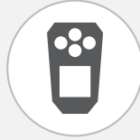
ALTAIR io 4