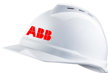
ABB Schutzhelm belüftet MSA V-Gard 500